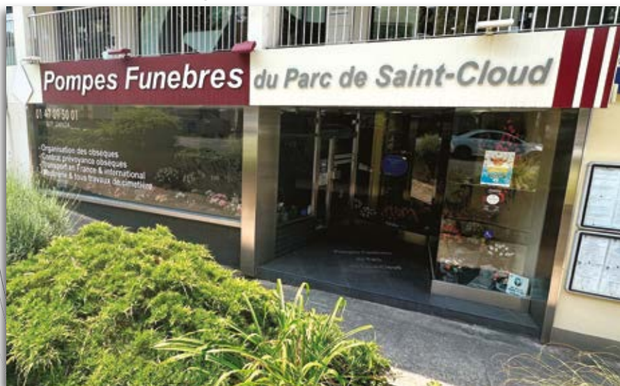
Pompes Funèbres du Parc de Saint-Cloud.