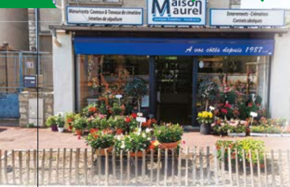
Pompes Funèbres Maurel.